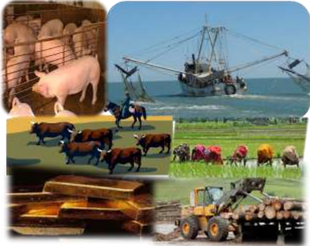
ACTIVIDADES ECONOMICAS PRIMARIAS